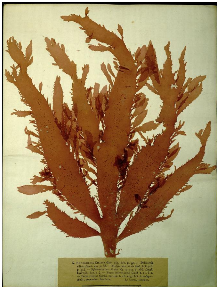
Fig. 5. Part n°5 de la centurie Lelièvre & Prouhet, Rhodomenia ciliata , 1841. CCEC, inv. 48012086.

L'inventaire des « petites » collections, trop souvent délaissées au profit des collections majeures, montre tout l'intérêt qu'elles peuvent éventuellement receler. Cet exemple, mené sur quatre ensembles botaniques en apparence peu captivants, a permis de mettre en évidence des spécimens intéressants sur le plan historique, deux syntypes et des informations diverses sur d'anciens collecteurs dont une femme botaniste oubliée de l'histoire des sciences.