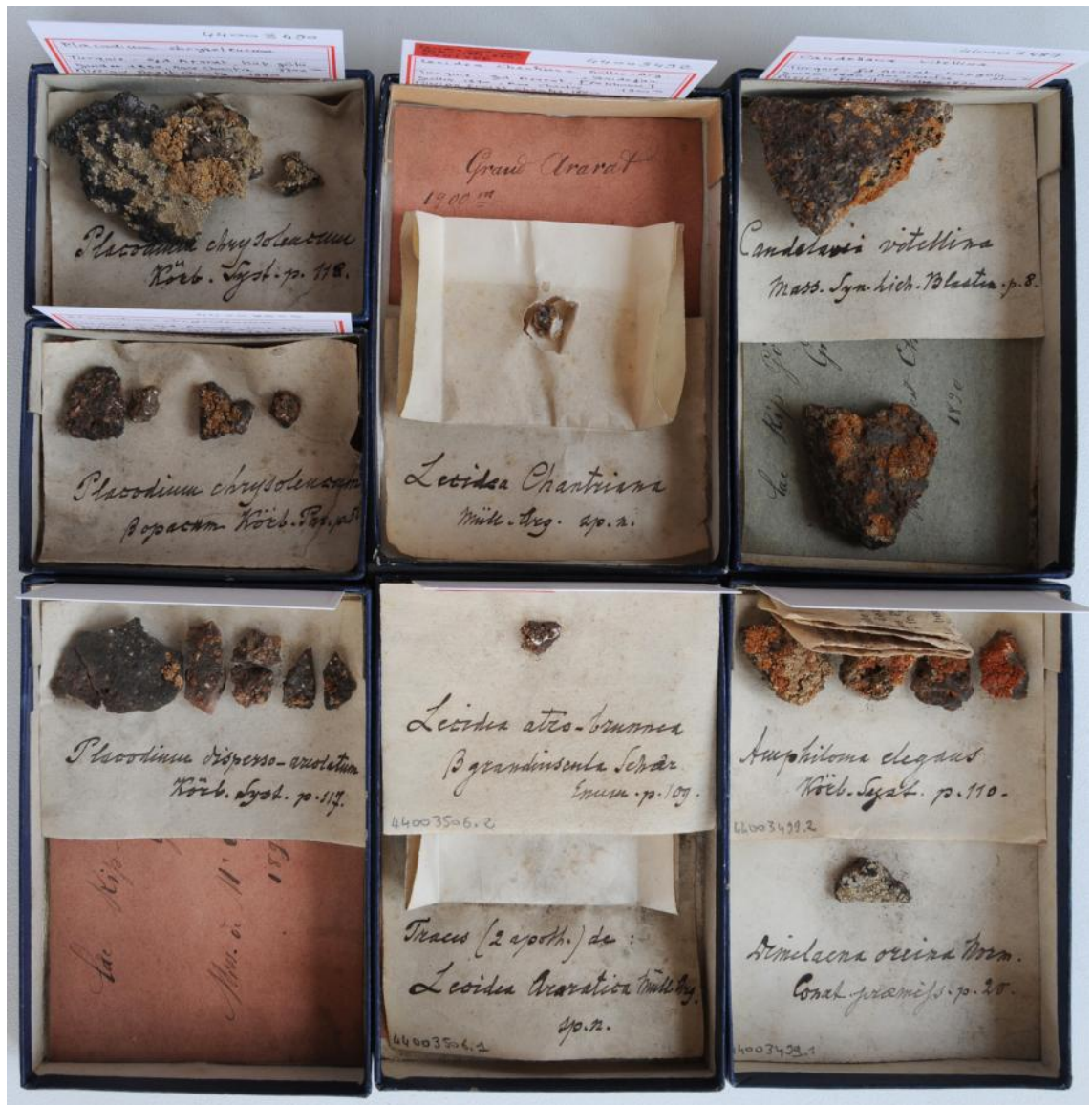
Fig. 4. Lichens rapportés par Jeanne Bellonie Chantre et étudiés par Jean Müller. CCEC, inv. 44003481 à 44003504.

Ils proviennent des environs du mont Ararat : au lac Kip (Küp gölü), au Petit Ararat (Küçük Ağır), Tekke deresi, près de Chahr [Şar], Arkhourî [Yenidoğan], entre 1800 et 3300 m, et ont été ramassés du 6 au 10 juillet 1890.