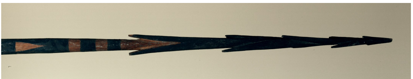
Fig. 3. Photographie d'une lance yapaise

Enfin, les barbelures ne sont stylistiquement pas micronésiennes. Sur l'exemplaire de Rouen elles forment des ailettes (simples ou dédoublées) dans le prolongement de cônes, se suivant l'un dans l'autre, sur le dernier tiers de la hampe. Ces barbelures sont assez courtes. Cette forme n'a rien de commun avec les barbelures des lances de Yap. À partir du corpus trouvé, il apparaît que les barbelures micronésiennes consistent en des chevrons courts emboîtés. De plus, il n'y a donc que deux barbelures sur les armes yapaises quand la lance de Rouen en compte quatre à six. À la lumière de tous ces indices, il est donc certain que la lance du musée de Rouen n'est pas micronésienne.