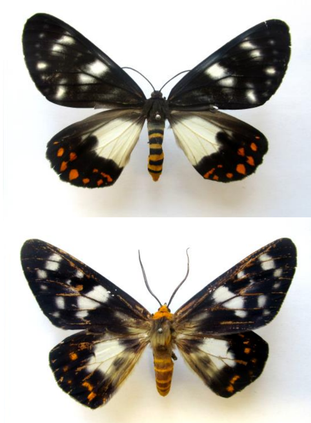
Fig. 1. Callistia angelus (en haut) et Dysphania tentans (en bas), tous deux de Fak Fak, Indonésie.

Le genre Dysphania Hubner, 1819 appartient à la sous-famille des Geometrinae (Ban et al. , 2018 ; Plotkin & Kawahara, 2020). Le genre rassemble 84 taxons (espèces et sous-espèces) (Scoble, 1999 ; Inoue, 2007). Un certain nombre de sous-espèces sont, depuis ce travail, considérées comme de simples synonymes. Ce sont des papillons de taille moyenne, pour la plupart vivement colorés, et généralement actifs aussi bien de jour que de nuit. Ils sont strictement localisés dans la région Orientale et, plus précisément, se rencontrent depuis la Chine, au nord, jusqu'en Australie, au Sud. Ils sont particulièrement diversifiés dans la région malayo-indonésienne. Beaucoup d'espèces ont des couleurs vives et aposématiques et sont mimétiques de Zygaenidae Chalcosiinae (mimétisme batésien) ou d'autres Geometridae Ennominae, notamment les genres Praesos et Callistia (mimétisme müllérien) (Fig. 1).