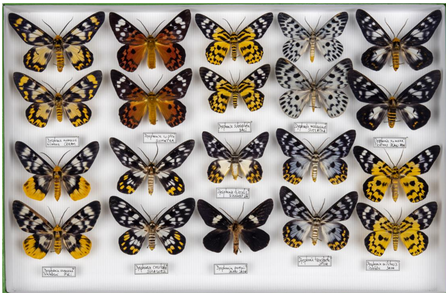
Fig. 2. Une boîte de Dysphania de la collection Porion, n°4619357.

L'ensemble des collections du musée a été passé en revue ; les plus riches sont celles de Guy Sircoulomb, de Thierry Porion (Fig. 2) et de Jean Poulard :